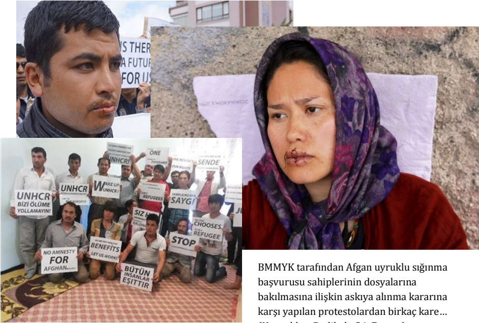
BMMYK tarafından Afgan uyruklu sığınma başvurusu sahiplerinin dosyalarına bakılmasına ilişkin askıya alınma kararına karşı yapılan protestolardan birkaç kare...

Son bir senedir tecrübe ettiğim kadarıyla Türkiye’de mültecileri ilgilendiren bazı değişiklikler oluyor. Eskiden mavi kimliklerimiz vardı, şimdi artık üzerinde yabancı kimlik numarası olan yeni bir kimlik kartı veriyorlar. Bu o kadar değersiz bir kart ki aslında hiçbir işe yaramıyor, çalışmana yaramıyor, en basitinden sim kart almaya bile yaramıyor. Kontrollü telefon hattı alabilmek için Türklere yalvarmak zorunda kalıyorsunuz.