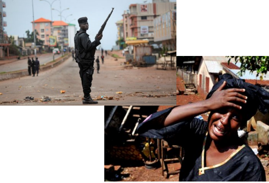
2010 yılında başkanlık seçimlerinden sonra Gine...

2010 Kasım ayında gerçekleşen başkanlık seçimlerinden sonra, seçim sonuçlarına karşı çıkan ayaklanmalarda birçok vatandaş hayatını kaybederken, birçoğu da ülkeden kaçmak zorunda kaldı. Politik ve etnik sebeplerden ötürü ben de ülkemi terk ettim ve Nisan 2011’de Türkiye’ye gelerek uluslararası koruma başvurusunda bulundum.