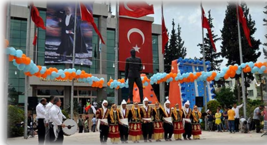
Reyhanlı Belediyesi öncülüğünde düzenlenen Türkiye- Suriye Dostluk Festivali’nden bir kare...

Türkiye’de, özellikle Reyhanlı’da karşılaştığım en büyük prolem ise, iş bulmanın mümkün olmaması. Çokca işe başvurduğum ve fakat dil bilmediğim ya da üniversite me- zunu olmadığım için hiçbirine ka- bul edilmedim. Suriye’de çıkan savaş nedeniyle üniversite eğitimi- mi tamamlama imkanım olmadı ve bu sebepten ötürü, Türkiye’de iş bulma olasılığım da azaldı.