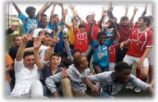
"7. Yeldeğirmeni ÇOGEM Futbol Turnuvası"ndan bir kare...

Yeldeğirmeni'ndeki öğretmenlerimiz bize yaşımız 18'e geldiğinde yurttan ayrılacağımızı söylüyorlar. Kendi işimizi bulmamız gerekecek, kendimize ev bulmamız gerekecek. Bazı arkadaşlarım bunun çok zor olacağını düşündükleri için yurttan kaçıyorlar ve Avrupa ülkelerine ulaşmaya çalışıyorlar. Bazıları Avrupa ülkelerine kaçmayı başardılar, onlarla sosyal medya üzerinden konuşuyorum. Orada okula gidiyorlarmış, spor yapıyorlarmış.