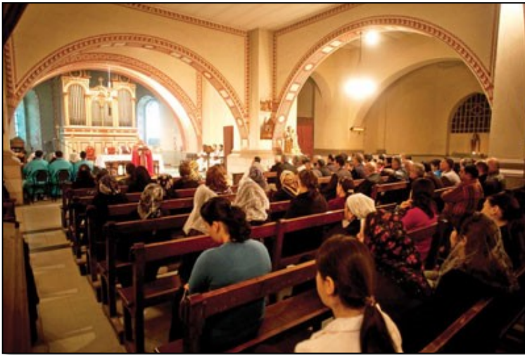
Kurtuluş mahallesinde bulunan İstanbul’un tek Keldani kilisesi. Cemaatinin önemli bir kısmını çeşitli zamanlarda Türkiye’ye iltica etmiş Iraklı mülteciler oluşturuyor

Türkiye’ye ilk geldiğimizde hastanelere gidemiyorduk. Kaç kere oğlum ve ben çeşitli sebeplerle İstanbul’da hastaneye gitmeye çalıştığımızda hastane görevlileri bize “Siz Suriyeli değilsiniz, bu hastaneleri kullanamazsınız” dediler.